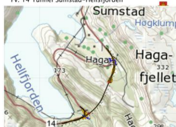
Fv. 14 Tunnel Sumstad-Hellsfjorden