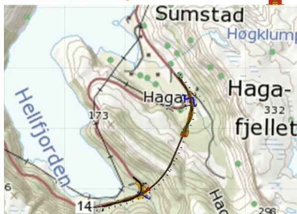
Fv. 14 Sumstad-Hellfjorden